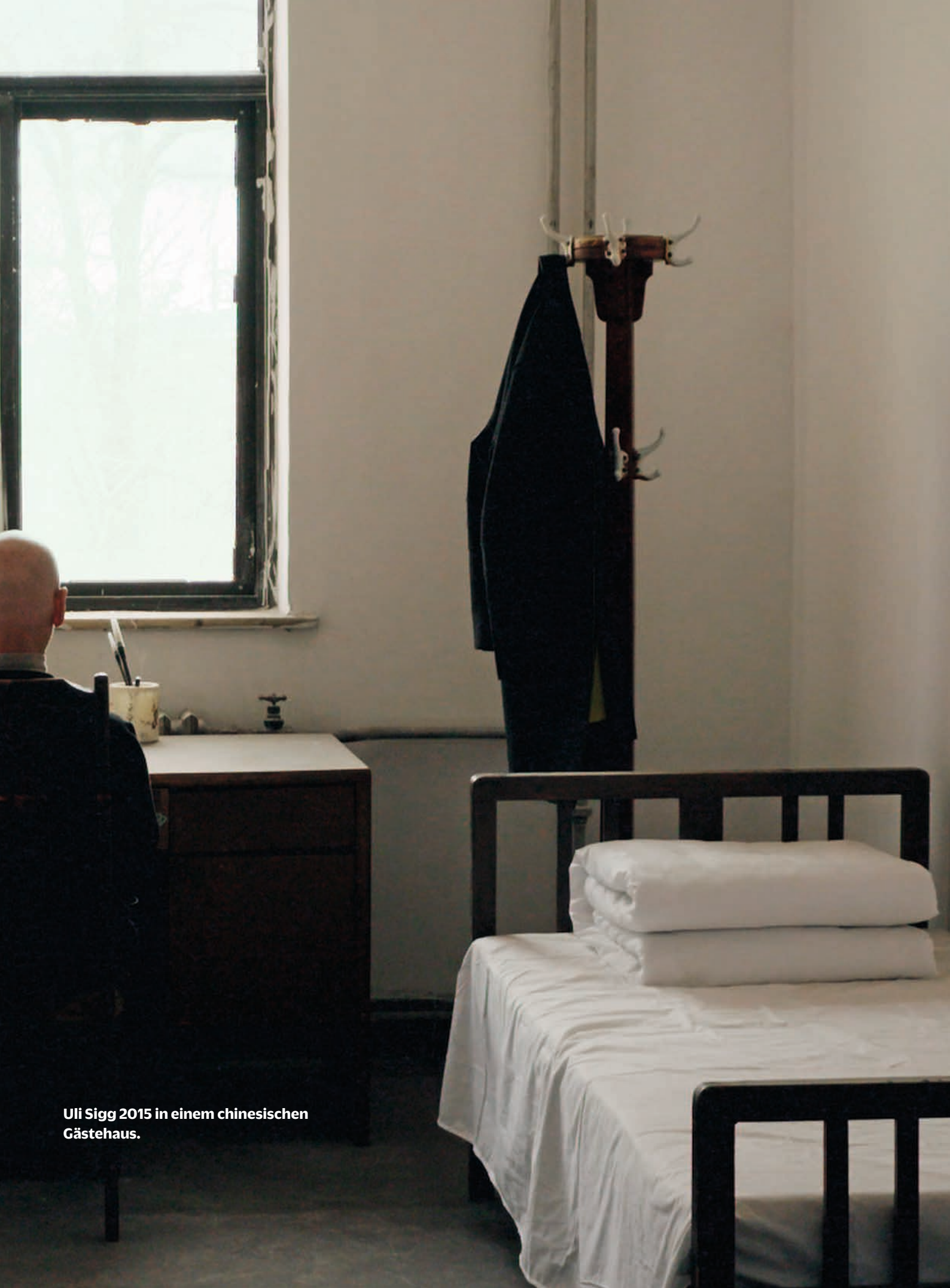
Uli Sigg 2015 in einem chinesisches Gästehaus.